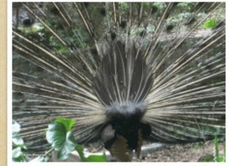
Πατήστε την εικόνα.

Η Ιστοσελίδα του ΡΟΔΟΣυλλέκτη!! http://www.rodosillektis.com/