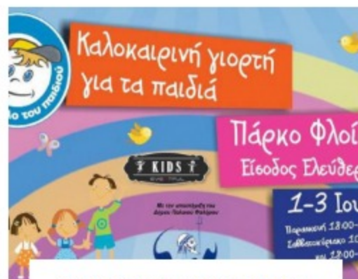
ΚΑΛΟΚΑΙΡΙΝΗ ΓΙΟΡΤΗ ΓΙΑ ΤΑ ΠΑΙΔΙΑ ΑΠΟ ΤΟ ΧΑΜΟΓΕΛΟ ΤΟΥ ΠΑΙΔΙΟΥ