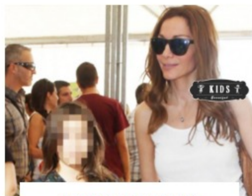
ΠΡΕΜΙΕΡΑ ΓΙΑ ΤΟ DISNEY ON ICE!