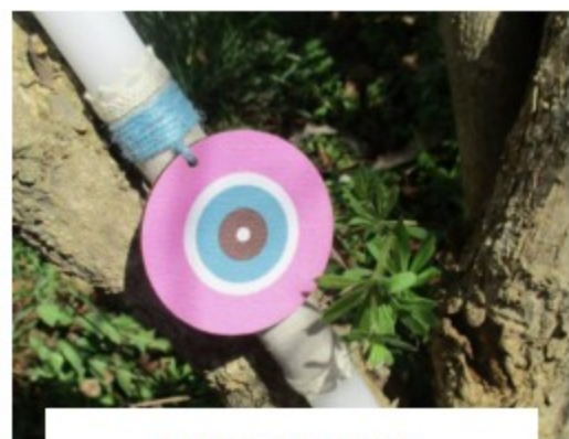
ΠΡΩΤΟΤΥΠΕΣ ΠΑΣΧΑΛΙΝΕΣ ΛΑΜΠΑΔΕΣ