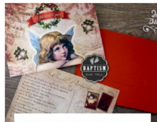
CHRISTMAS BAPTISM INVITATIONS