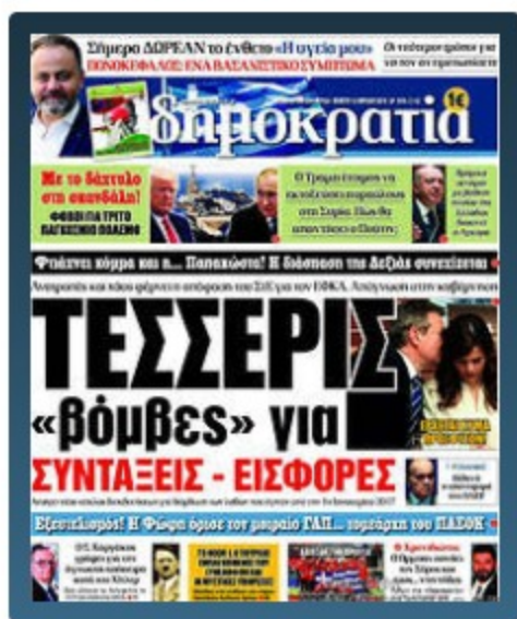
Τα πρωτοσέλιδα των εφημερίδων