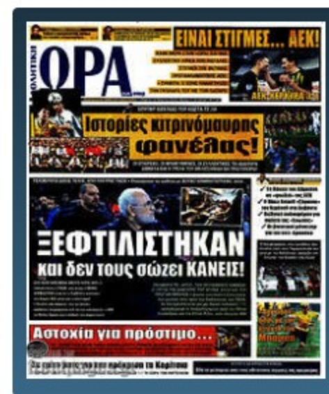
Τα πρωτοσέλιδα των εφημερίδων

Νεότερη ανάρτηση Αρχική σελίδα Παλαιότερη Ανάρτηση