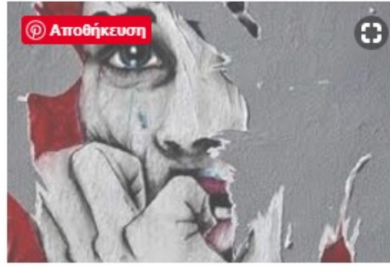
Δυο εξομολογήσεις: «Αγια πόλη» του Γκιγιέρμο Ορσι και «Πέντε στάσεις» του Μάκη Τσίτα