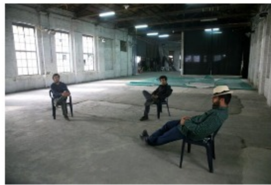
Μουσικές θεραπείες μετά την καραντίνα