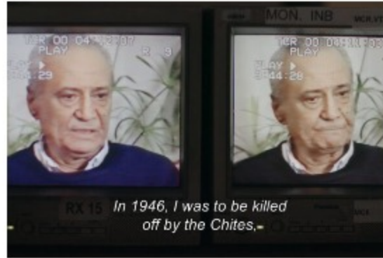
Νίκος Καρούζος: Ο Δρόμος για το Έαρ, online στο 22ο Φεστιβάλ Ντοκιμαντέρ Θεσσαλονίκης