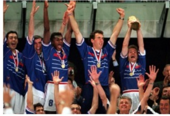
«Και μετά από αυτούς τα παιδιά τους» του Νικολά Ματιέ