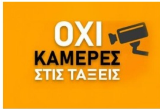
Κάμερες και «γδαρμένοι ζωντανοί» στα σχολεία