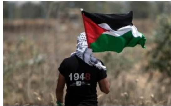
Νάκμα: η «Καταστροφή» που δεν τελείωσε ποτέ