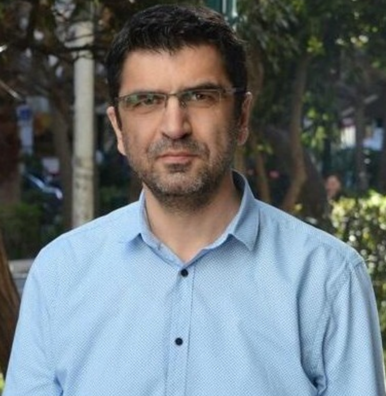
ΜΑΚΗΣ ΤΣΙΤΑΣ. Μάρτυς μου ο Θεός. Μυθιστόρημα. Μεταίχμιο, 2020. Σελ. 280.