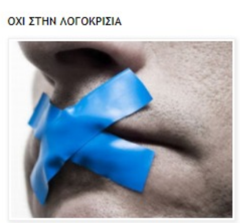
Όχι στην λογοκρισία - Ναι στην άποψη