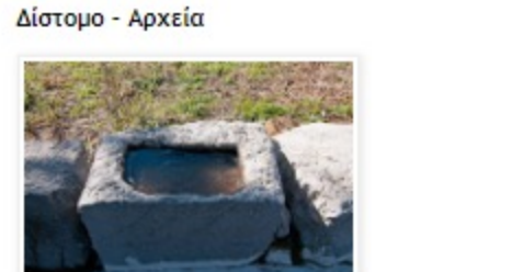
Ενημερωθείτε για την ιστορία του Διστόμου, με ένα ΚΛΙΚ επάνω στην εικόνα

Email επικοινωνίας katsabin@otenet.gr Για να στέλνετε δικά σας άρθρα και να μου γράψετε οτιδήποτε σας αρέσει ή χρειάζεται βελτίωση.