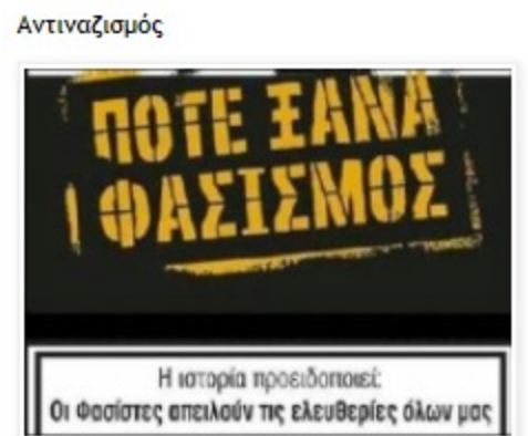
Ποτέ ξανά φασισμός

Δημοσίευση σχολίου Νεότερη ανάρτηση • Αρχική σελίδα • Παλαιότερη Ανάρτηση Εγγραφή σε: Σχόλια ανάρτησης (Atom)