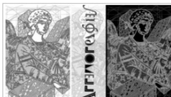
«ΑΓΓΕΛΟΓΡΑΦΙΕΣ»: Έκθεσι των πρωτότυπων έργων μιας εικαστικής παρέμβασι που έγινε στη Καβάλα