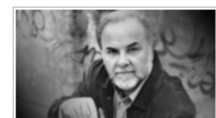
Γυναϊκών: Του Μιχάλη Γκανά.