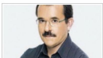
Το ημερολόγιον της κρίσις περιγράφει ο Πάυλος Τσίφτις στο βιβλίο...