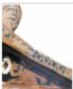
Κειμήλιον από τα Μουσείον