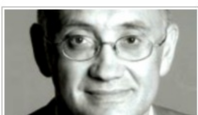
Καπιταλισμός εντός νόμου: Η επιστροφή του Marc Roche μετά από...