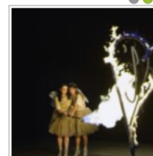
Smashing Pumpkins: Εργαστήριον με παγκόσμιον μέλος στο σχήμα!