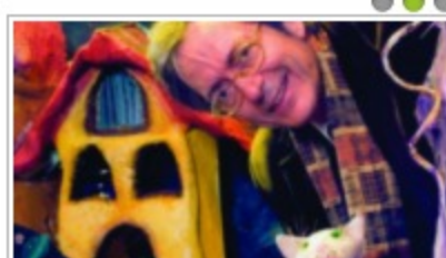
Παραμύθια, Ντορεμπίνα από τον αγαπημένο μας παραμυθά!